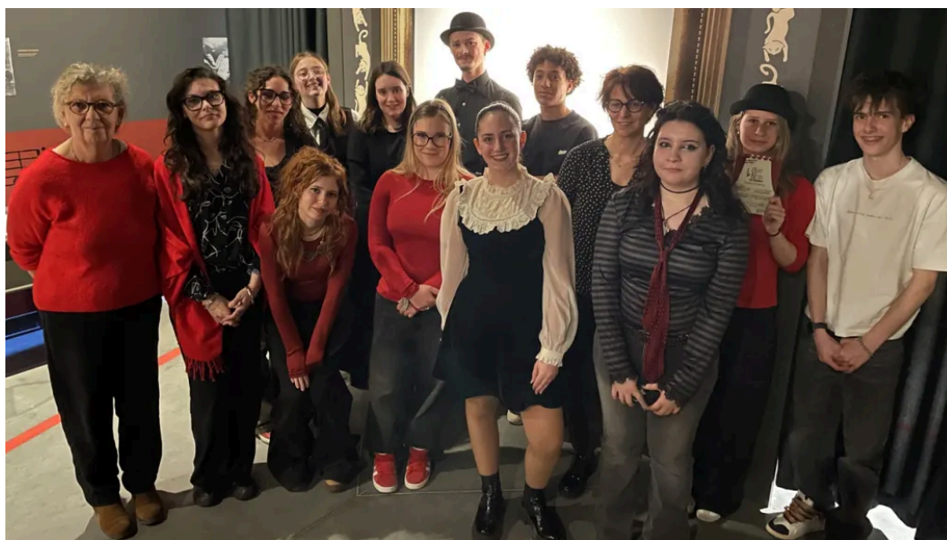
Leurs ombres ont mis en lumière le Chat noir de Rodolphe Salis à La Manu.

ABONNÉS Cet article est réservé aux abonnés numériques.